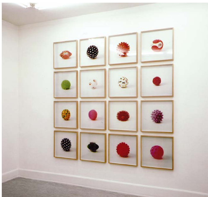
Robert F. Hammerstiel, installation view of the series “Glücksfutter”, 1998, Cibachrome, each ca. 52 x 52 cm

“Indeed, even the innermost and actually central mark of the methods of the modern imagination seems to lie in this strangely urgent meaning of the object. The subject – having become more important than man – achieves the dramatic significance which nineteenth-century literature had for the imagined matter. This, of course, can only happen because the object of ‘dead’ nature is given a peculiar life today; the object has become excitingly interesting for us. The more modern man looks at the objects and feels that they are to be among the surroundings of his psyche, the more astonishing and enchanting their vital stirrings become. Let us remember Alphonse Chateaubriand’s famous insistent description of a butterfly, or Marcel Proust’s descriptions of furniture and things, where,