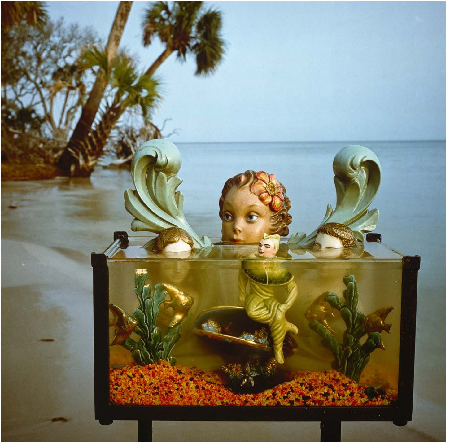
Arthur Tress, from the series "Fish Tank Sonata", 1989, Cibachrome, 38 x 38 cm